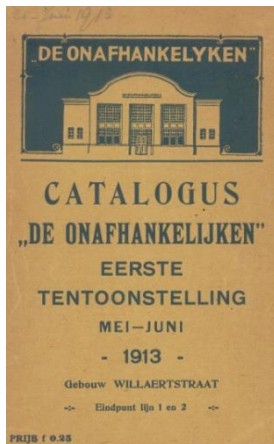
Catalogus van de eerste juryvrije tentoonstelling van De Onafhankelijken, mei-juni 1913.

Bij de Amsterdamse kunstenaarsvereniging De Onafhankelijken was het niet anders en maakten vrouwen de eerste jaren van haar bestaan geen deel uit van het bestuur. Dit is opvallend te noemen, omdat De Onafhankelijken zich juist afzette tegen de heersende normen binnen de bestaande kunstenaarsverenigingen. De jonge kunstenaars die De Onafhankelijken in 1912 oprichtten, waren